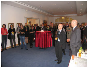
Vernissage im Konferenzraum