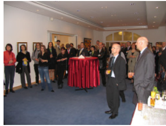
Kiállításmegnyitó a konferenciateremben