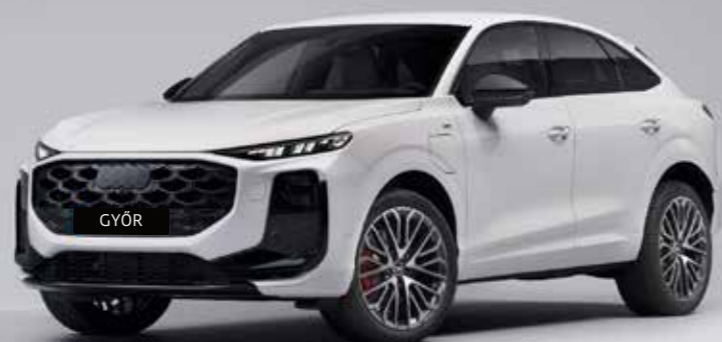
Audi Q3 from Győr